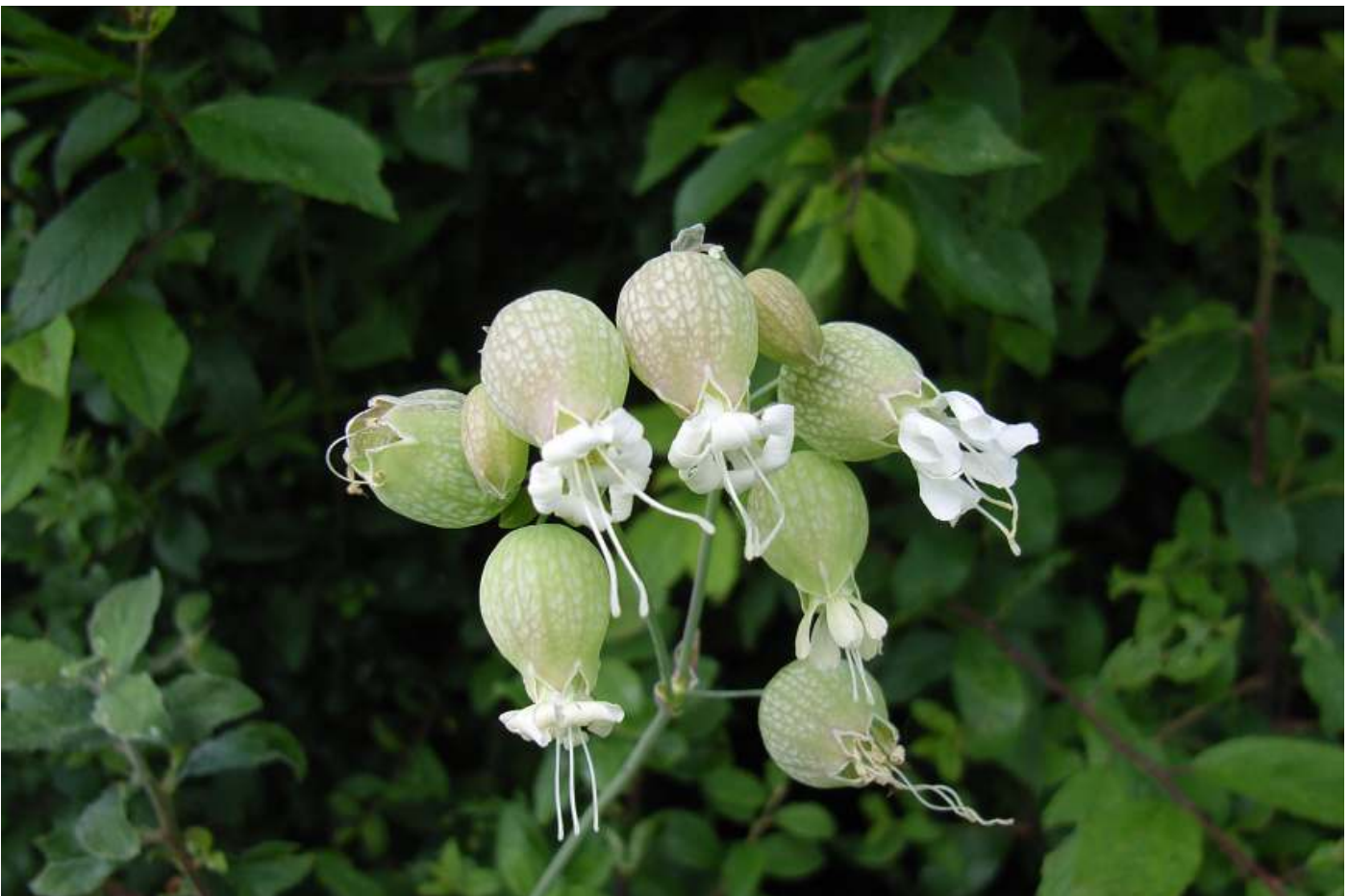
Blaassilene Silene vulgaris