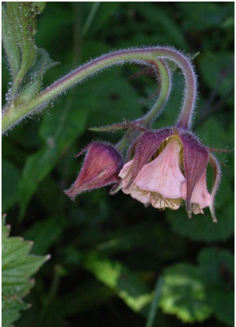
Knikkend nagelkruid, Geum rivale

de tuingrond, door er gemalen kalksteen uit te strooien. Koningsvaren steekt bijna boven alles uit, zelfs boven de Prachtklokjes. In een hoek staat Spaanse zuring. Verder ook Betonie, Geel zonneroosje, Aardpeer en Kleine kaardenbol. Volgens Thijs moet ik goed voor me kijken want daar groeit zijn trots. Aan een sierappeltje groeit de bolvormige, altijd groene halfparasiet Maretak. Het betreft een tweehuisige soort en in dit geval is het een vrouwelijk exemplaar die witte bessen draagt. Thijs heeft dit kleinnood opgehaald in Moergestel. In een bijna droog gevallen water-