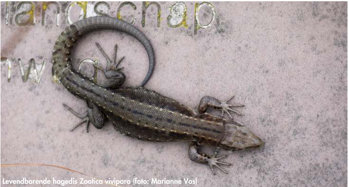
Levendbarende hagedis Zootica vivipara