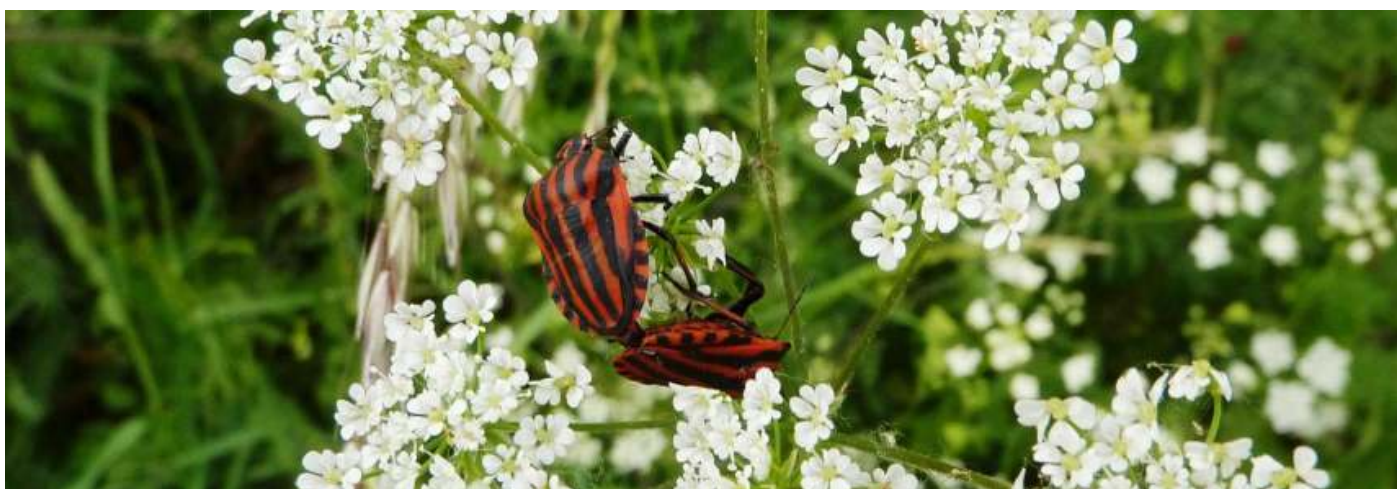
Pyjamawants, Graphosoma lineatum

We gaan het meer waarderen om buiten in de natuur te mógen zijn. Kijken met andere ogen om ons heen, kweken daardoor een beter milieubewustzijn Als het straks beter gaat zullen we dan onze natuur beter beschermen? Hopelijk leren we ervan en gaan we ons er met zijn allen over ontfermen