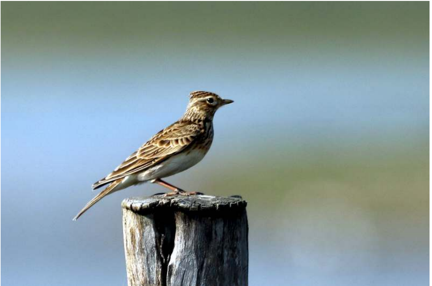
Veldleeuwerik (foto: Jac Janssen) (CC BY-NC-SA2.0)