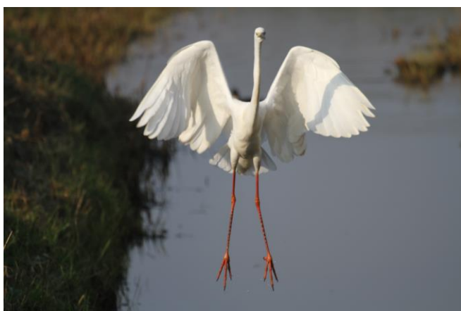
Grote zilverreiger

De Brandt, zondag 18 maart 2018. Het is slechts -1°C en daarbij een zeer koude noordoostelijke wind. In het cursusboekje staat "wees op tijd en...goed gekleed, want het kan 's morgensvroeg nog flink koud zijn". De deelnemers hebben deze aanbeveling niet in de wind geslagen. Onze voorzitter deelt mede dat de excursie i.v.m. de weersomstandigheden tot ongeveer 10.30 uur duurt. Onze groep wandelt richting Visplas. Op de plas weinig watervogels, we zien wel; Kuif- en Wilde eenden, Aalscholvers en Meerkoeten, langs de rand Merels en Kramsvogels, oude knaagsporen van de Bever, maar ook fraaie Beverwissels. We lopen verder met de sterke wind in de rug, het is dan een stuk aangenamer. We wandelen richting Maas, een eenzame Reegeit rent langs de rand van de Visplas, de spiegel is goed te zien. Aan de overkant van de Maas grazen Koniks en Galloways, bij de koeien loopt nog een kalf van enkele dagen oud. Langs de oever diverse Canadese ganzen, tussen het gras Grauwe- en Kolganzen, bij de Kolganzen valt de witte