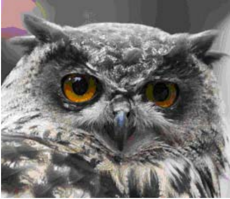
Oehoe in Gangelt