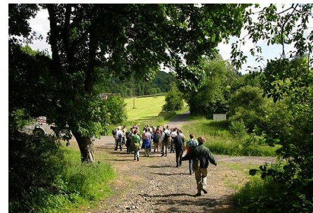
Achenlochhöhle/ Gillesbachtal 2008

Busexcursie naar de Eifel. Met speciale aandacht voor de flora en insectenfauna. Alleen voor leden.